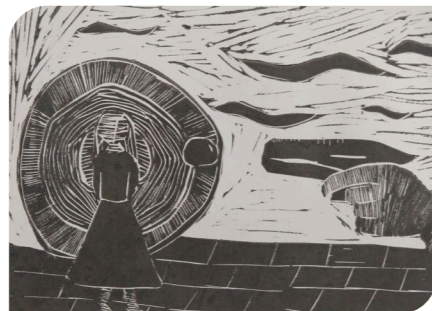
Linocutdruck von Lino-Sophie Schlößner

Für einige Wochen im Mai 2023 waren in der Aula und im Foyer unserer Schule gelungene Arbeiten aus dem Kunstunterricht zu sehen. Den aufmerksamen und interessierten Besucherinnen und Besuchern bot sich ein breites Spektrum an Gemälden, Zeichnungen, Druckgrafik und Plastiken. Aber was zeichnet eine gelungene Arbeit aus? Diese Frage kann aus vielen verschiedenen Perspektiven diskutiert werden! Eine mögliche Antwort bietet sich beim Betrachten der Arbeiten, die mit dem Preis der Schul-Kunst-Ausstellung ausgezeichnet wurden.